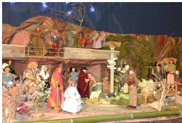
Crèche de Notre Dame de Tous Pays

Abonnement par mail : si vous souhaitez recevoir gratuitement ce journal au format PDF, envoyez votre adresse mail à : journalnddp@gmail.com